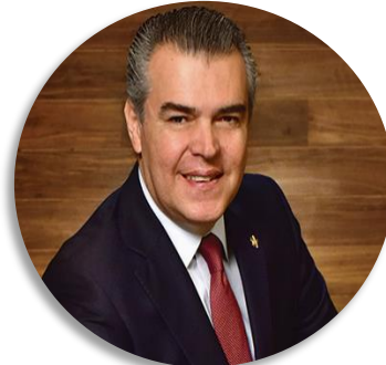
Francisco Cervantes Díaz Presidente de Confederación de Cámaras Industriales