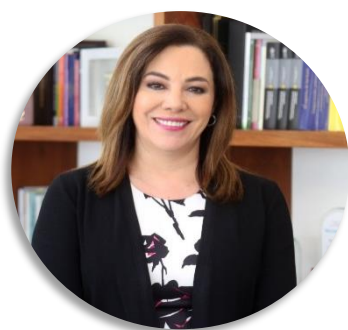
Blanca Lilia Ibarra Presidenta del Instituto Nacional de Transparencia, Acceso a la Información y Protección de Datos Personales